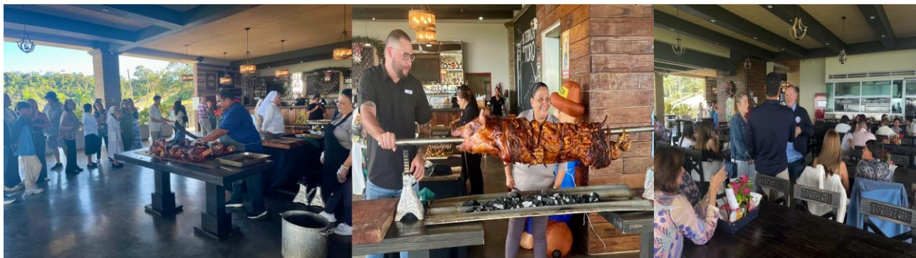
Latidos de Esperanza — Diciembre 6, 2025 · Toro Verde, Orocovis