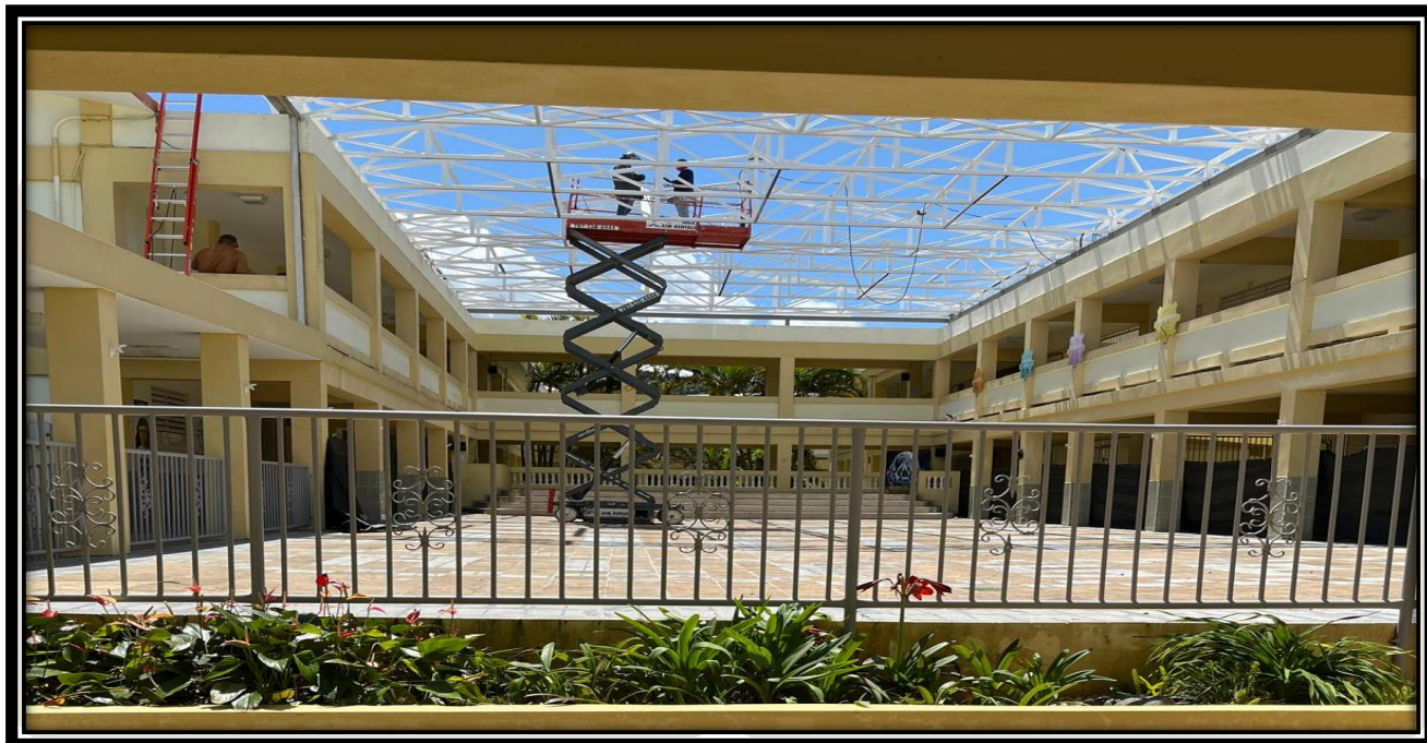
Una elegante cuadrícula de acero blanco que se eleva hacia el cielo. La estructura espacial de acero terminada que abarca todo el atrio central.