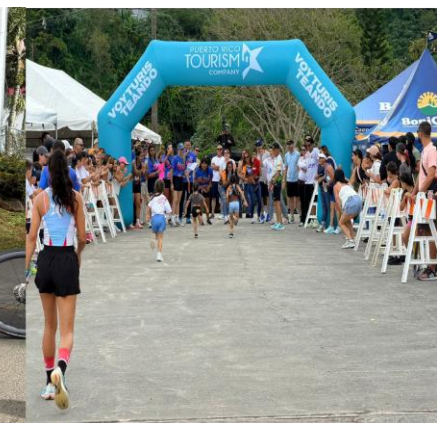
Familias, corredores y comunidad unidos por ALESPI