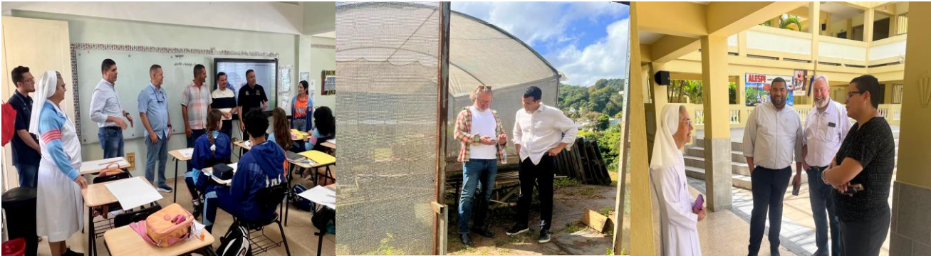
Government, private, and corporate partners touring the facility and committing support

"Mi camino en ALESPI comenzó como estudiante. Hoy tengo el honor de servir como Directora en el mismo hogar donde crecí. Soy testimonio vivo de cómo ALESPI transforma a sus estudiantes en ciudadanos comprometidos, capaces de liderar con el corazón."