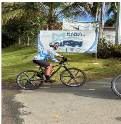
ALESPI 5K & Bicicletada · 12 de Abril 2026