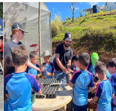
Estudiantes participando en un aprendizaje agrícola práctico

“No solo estamos instalando un techo; estamos creando un santuario duradero de esperanza y alegría para los futuros líderes de Puerto Rico.” Sor Araceli Reyes, Directora