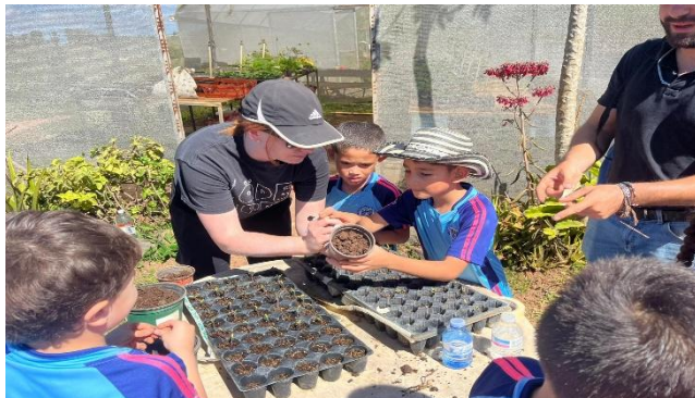
Cada semilla plantada es una lección de administración y esperanza.